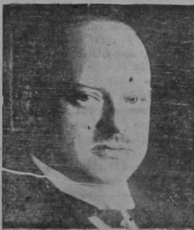
El Ministro de Relaciones Exteriores alemán, Stressemann

En general se cree, por las declaraciones que el señor Palacios hiciera al correspondiente del «Berliner Tageblatt», que España piensa desatenderse por completo de los negocios de la Liga.